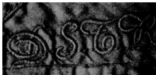
detail stiksel op rug