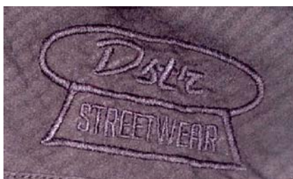
stiksel boven borstzak