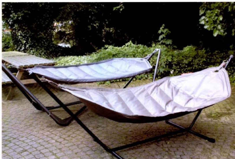
Voor: HEADDEMOCK / achter: Ottawa hangmat