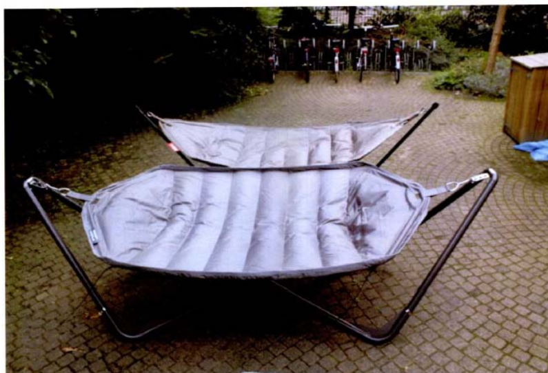
Voor: Ottawa hangmat / achter: HEADDEMOCK