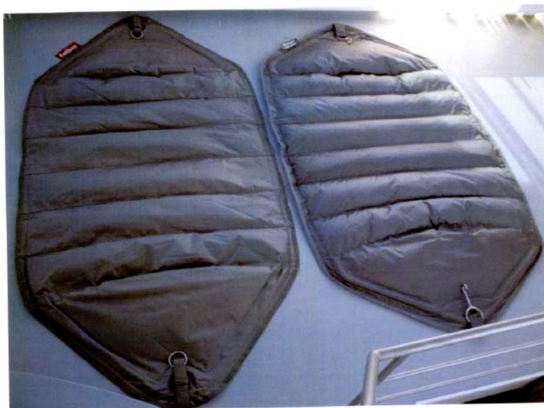
Links: HEADDEMOCK / Rechts Ottawa hangmat

2.2. De Headdemock en de Ottawa hebben een vormgeving zoals hieronder afgebeeld.