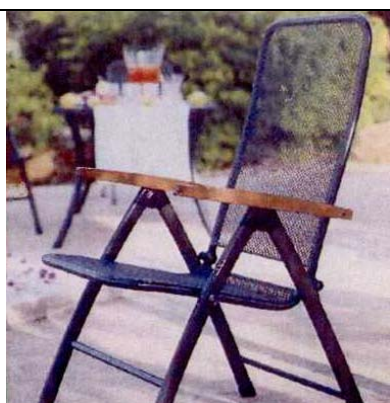
Tapa van Royal Garden

2.4. Met partijen neemt de rechtbank tot uitgangspunt dat de beschermingsomvang van Model 6051 mede (naast bijvoorbeeld de mate van ontwerp vrijheid) wordt bepaald door het vormgevingserfgoed ten tijde van de prioriteitsdatum van het depot (23 december 2002). Als productie 4.15 bij conclusie van eis in reconventie heeft Garden Impressions onderdelen van een Nederlandstalige brochure overgelegd met daarin de hierna afgebeelde tuinmeubelen uit de collectie 2003 van het merk Royal Garden (stoel Tapa, pagina 11) respectievelijk van het merk Preston (stoel Comfort, pagina 16), stellende dat deze stoelen op 1 april 2003 – daarbij ten onrechte uitgaand van de depotdatum en niet van de prioriteitsdatum van 23 december 2002 – aan het publiek ter beschikking waren gesteld.