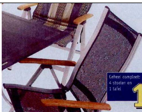
Comfort van Preston