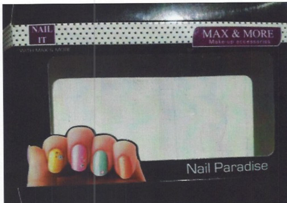
voorkant Nail Paradise nagelset