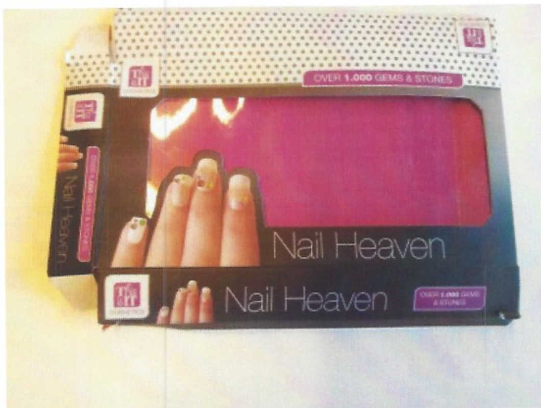
voorkant Nail Heaven nagelset

2.2 In maart 2011 heeft Intertoys een grafisch ontwerpster verzocht een verpakkinglijn te ontwerpen, waaronder de verpakking van een nagelset die Intertoys onder de naam Nail Heaven (verder: de Nail Heaven nagelset) in de hierna afgebeelde verpakking in september 2011 op de markt heeft gebracht.