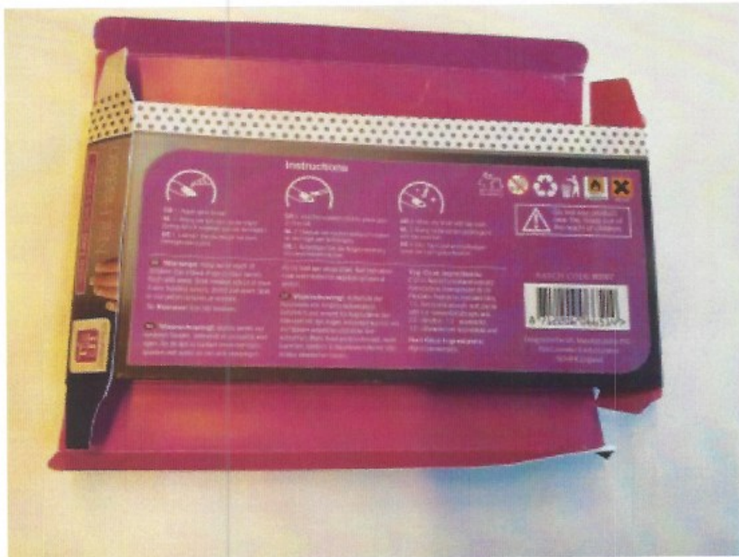
achterkant Nail Heaven nagelset

2.3 Action is een in Nederland, België, Duitsland en Frankrijk opererende onderneming in onder meer huishoud- en speelgoedartikelen. D-Dutch is leverancier van Action.