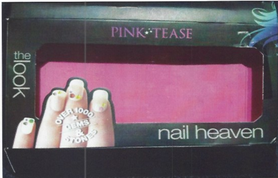
voorkant Pink Tease nagelset