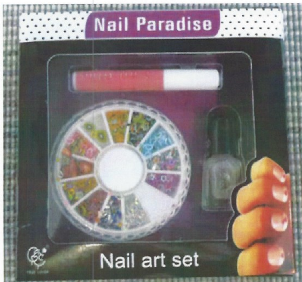
voorkant Nail Art nagelset