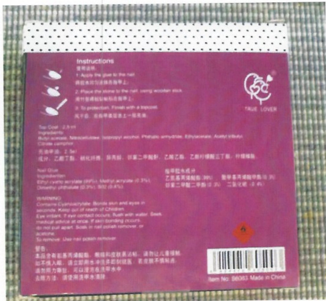
achterkant Nail Art nagelset

3.4 Volgens Action c.s. heeft de Pink Tease nagelset model gestaan voor het ontwerp van Intertoys. Action c.s. stelt voorts dat de verpakking van Intertoys niet is nagemaakt, zodat Intertoys zich niet op inbreuk op het niet-ingeschreven model kan beroepen (vergelijk artikel 19 lid 2 GModVo). De Nail Paradise nagelset zou daarentegen zijn afgeleid van de Nail Art nagelset.