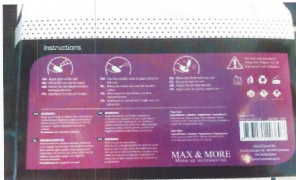
achterkant Nail Paradise nagelset