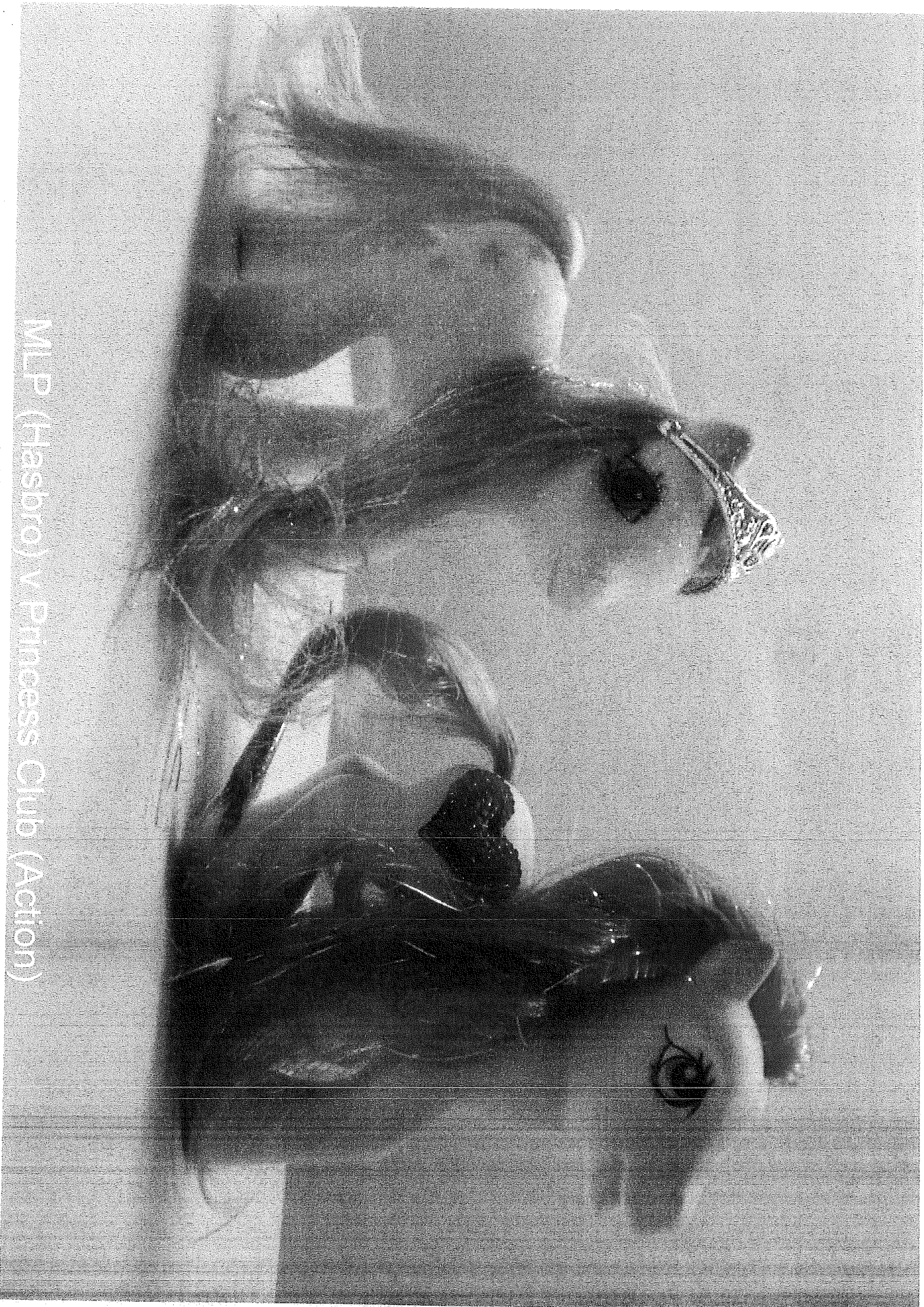
MLP (Hasbro) v Princess Club (Action)