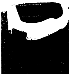
Kattenbak 1 AK For Pet's