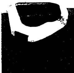
Kattenbak 1 Europet

2.4. De bakken van Europet en van AKFP zien er als volgt uit.