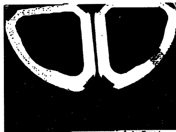
Kattenbak 1 Links: AK For Pet's Rechts: Europet