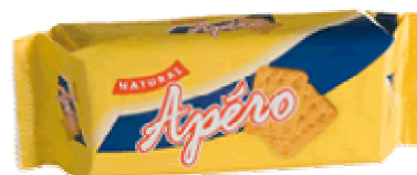
De door Hoppe gebruikte verpakking