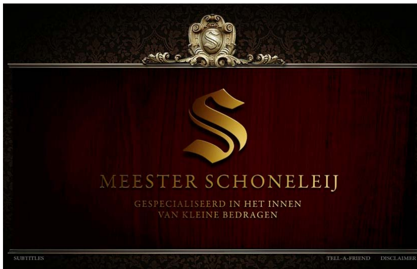
Fig. 4: afbeelding "Meester Schoneleij" aan het eind van het fragment