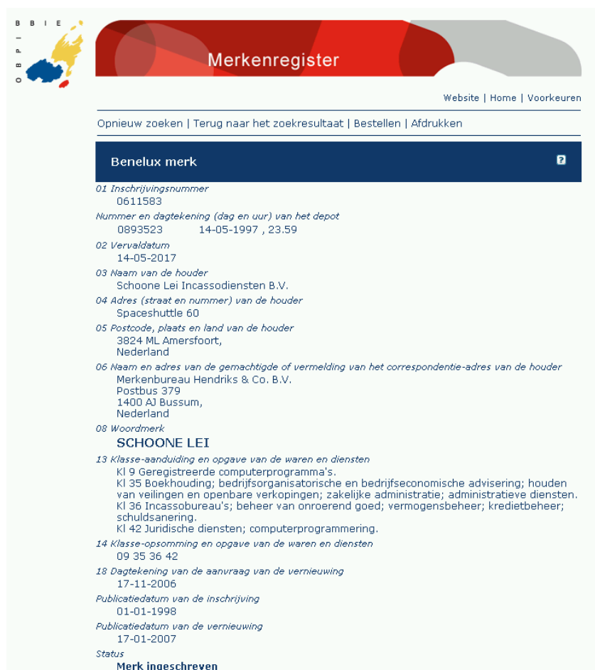
Fig. 1: inschrijving van het woordmerk SCHOONE LEI