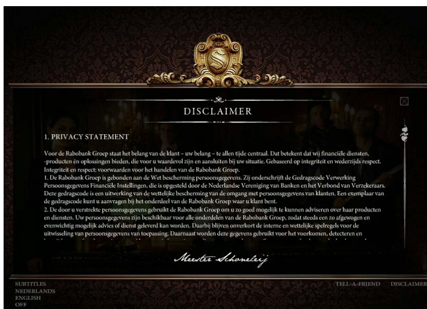
Fig. 5: deel van de disclaimer onderaan de website www.schoneleij.nl