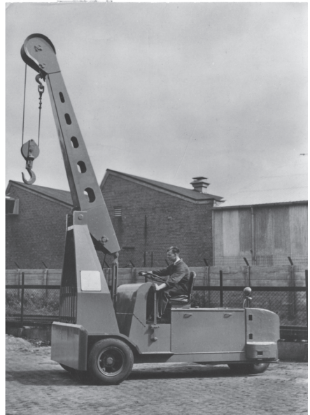
Figuur 1. De 'Elephant' van Thole (rechts) is geen onrechtmatige 'slaafse nabootsing' van de 'Karry Crane' van Hyster (links). HR 26 juni 1953, NJ 1954, 90, Thole/Hyster; hijskraan.