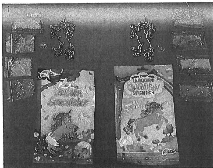
Designer: Louise Heathcote

4.21.5. Het voorgaande geldt niet voor de inhoud van het product, omdat RMS c.s. onvoldoende hebben gesteld om te kunnen aannemen dat zij daarvan de ontwerper zijn.