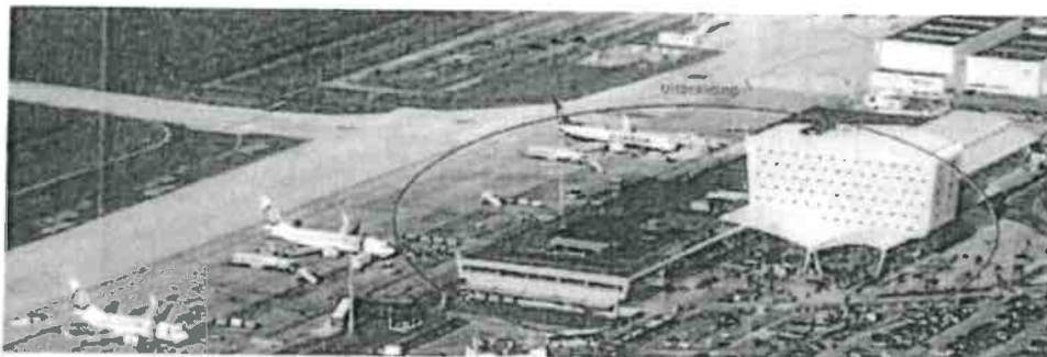
(beide uit prod. 15 Kcap)

2.11. Op 10 april 2013 heeft De Bever een eindfactuur aan EA gestuurd ter zake van de werkzaamheden die samenhangen met de Opdracht 2011.