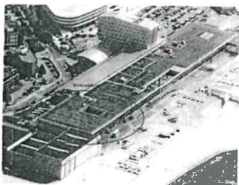
(beide uit prod. 15 Kcap)

2.13. De Bever heeft in opdracht van EA een gebouw ontworpen dat door partijen het Multi Purpose gebouw wordt genoemd. In een publicatie van 8 juni 2015 is de bouw